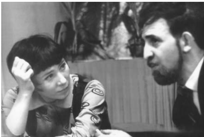
Елена Камбурова и Ефим Друц