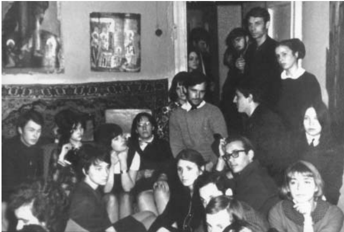
Домашняя встреча «Спектра»